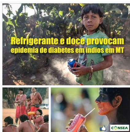
Figura 3 – Perda de identidade cultural do alimento