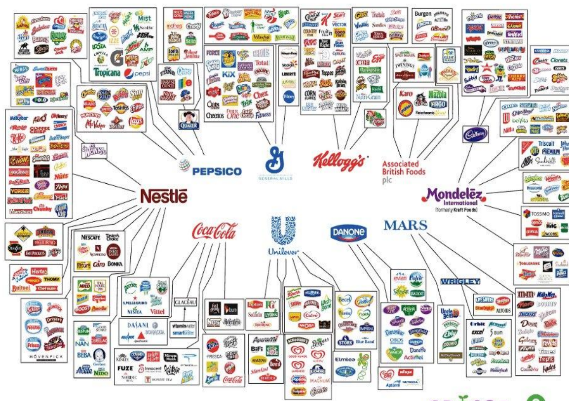
Figura 4- Maiores empresas produtoras de alimentos e bebidas

coletivamente conhecidos como ABCD – controlam 90% do comércio global de grãos (OXFAM, 2014, p.37).