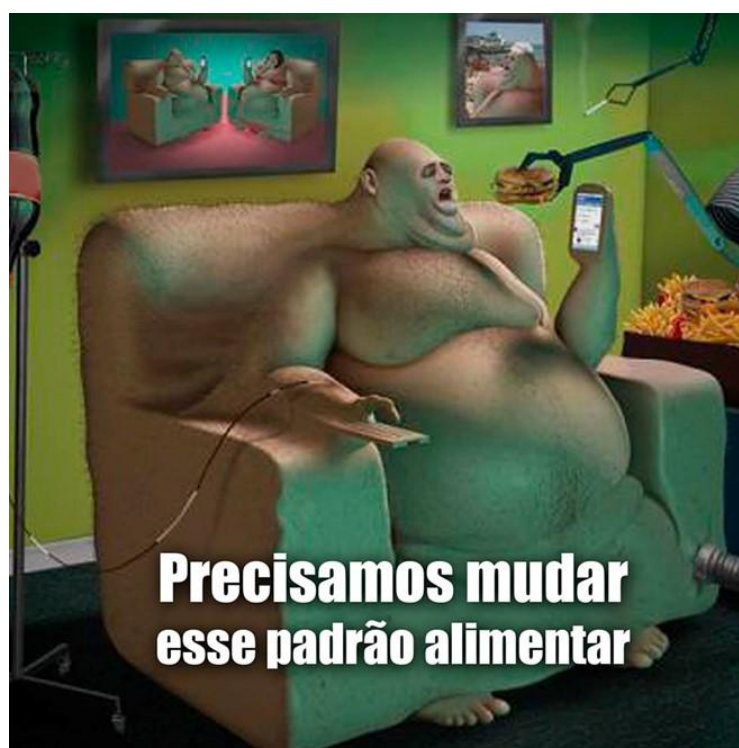
Figura 5- Hábitos alimentares e supressão do espírito crítico