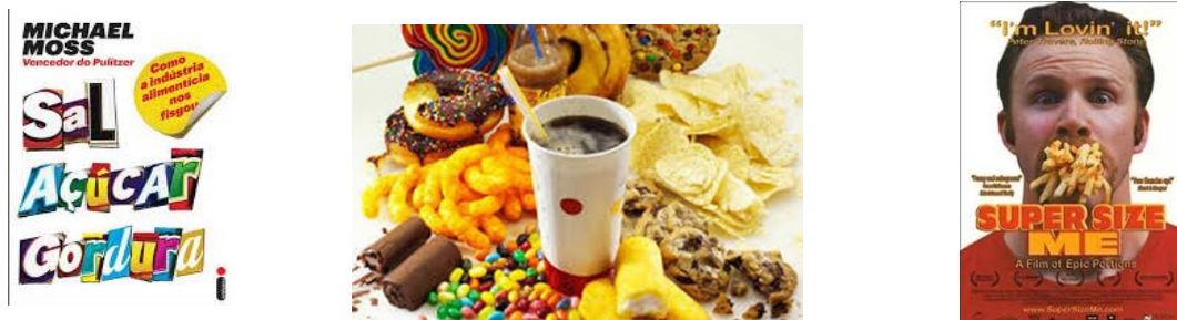
Figura 6- Influência do marketing e a publicidade nos hábitos alimentares