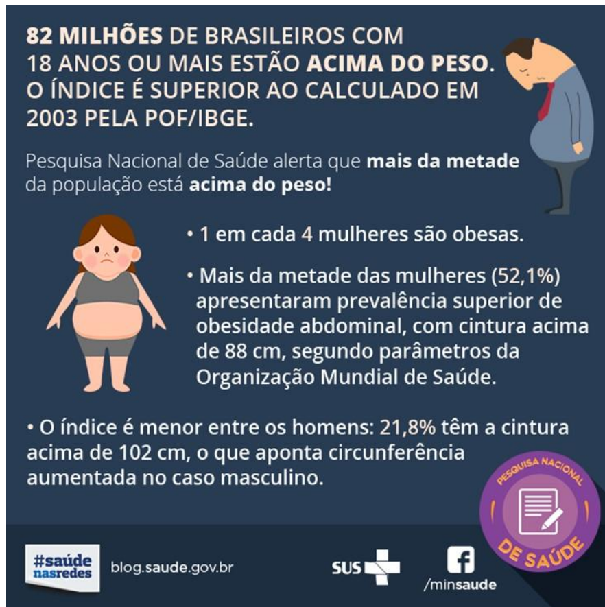
Figura 7- Obesidade e ambientes obesogênicos

A obesidade afeta tanto os países ricos quanto os países pobres, especialmente nas últimas décadas, o que tem levado ao uso do termo “globesity”, considerando-o como um processo contemporâneo resultante do progresso econômico e da globalização (BLEICH, 2007; JÉQUIER AND TAPPY, 1999; POPKIN, 2001, apud COSTA-FONT, 2013, p.8).