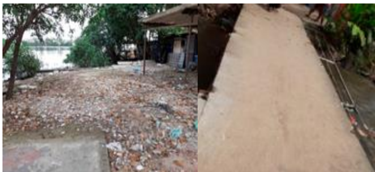
Figura 5. À esquerda, espaço aberto com detritos às margens da Baía de Guanabara, e à direita, ponte que liga as duas comunidades vizinhas, Praia da Rosa e Sapucaia; as imagens foram registradas durante a visita técnica.