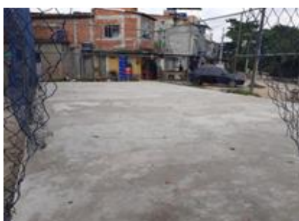
Figura 6. Quadra incompleta com proteção danificada; imagem registrada durante a visita técnica.

Finalmente, a Figura 6 abaixo, mostra a imagem de uma quadra não finalizada e já entrando em estado de deterioração.