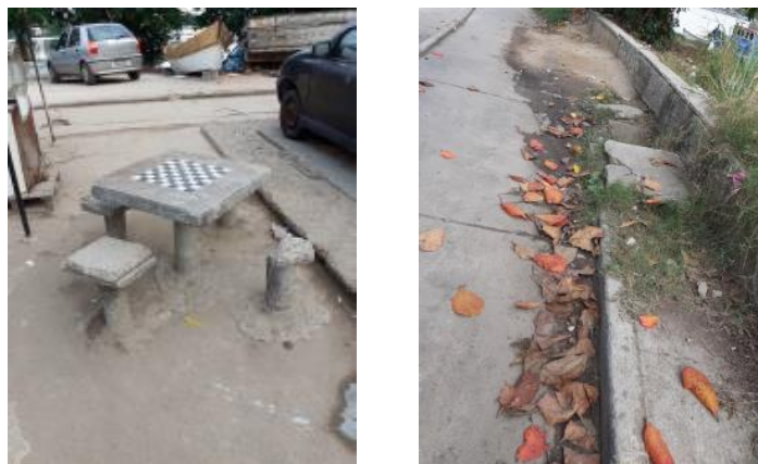
Figura 4. À esquerda, banco de praça danificado e à direita, percurso danificado da ciclovia, observados e registrados durante a visita técnica.