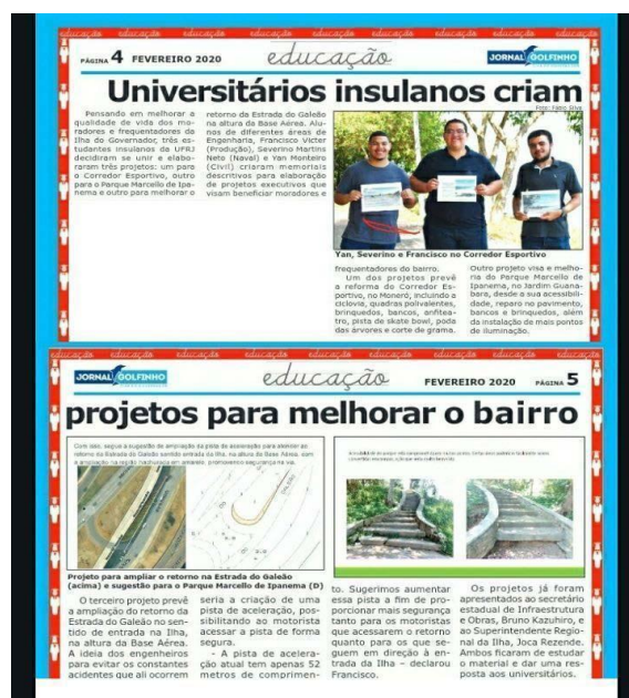
Figura 2. Recorte da publicação feita na edição de 4 de fevereiro de 2020, do Jornal Golfinho sobre o projeto Engenhando a Cidade.