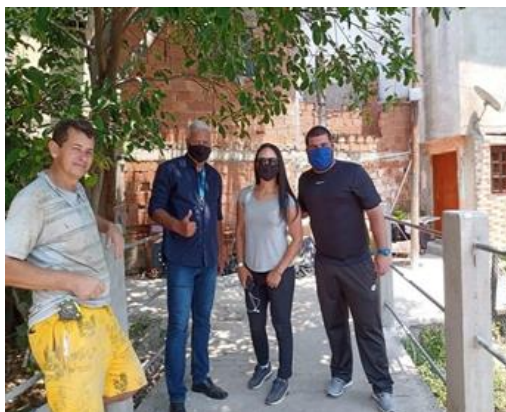
Figura 3. Vice-presidente da AMUIG, junto dos representantes da Secretaria de Infraestrutura de Obras do Estado, após a conclusão da ponte, que liga e integra a comunidade da Praia da Rosa a Sapucaia.