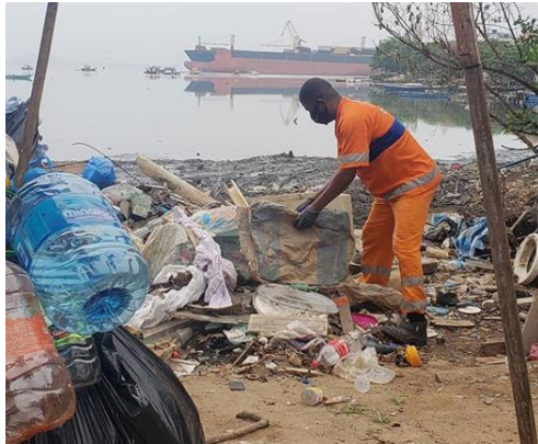
Figura 8. Funcionário da COMLURB recolhendo lixo na margem da Baía de Guanabara.